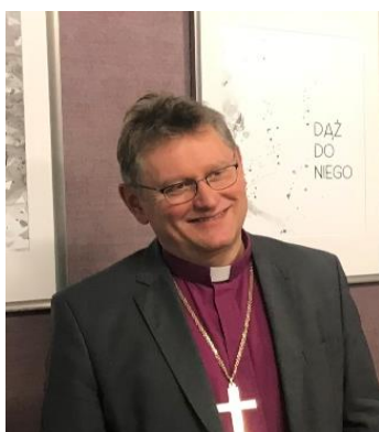
Leitender Bischof Jerzy Samiec

Das geistliche Oberhaupt der Kirche ist der Leitende Bischof der Evangelisch - Augsburgischen Kirche in Polen. Er ist auch Präses des Konsistoriums. Amtsinhaber ist Jerzy Samiec. Sein Bischofssitz ist in Warschau.